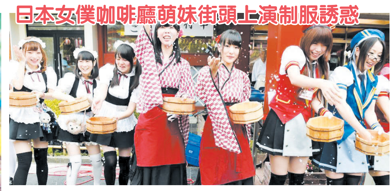
日本女僕咖啡廳萌妹街頭上演制服誘惑