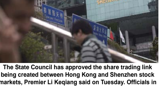
The State Council has approved the share trading link being created between Hong Kong and Shenzhen stock markets, Premier Li Keqiang said on Tuesday. Officials in Hong Kong said they hoped the link will be up and running by Christmas.

Compiled And Edited By John T. Robbins, News&Review Editor