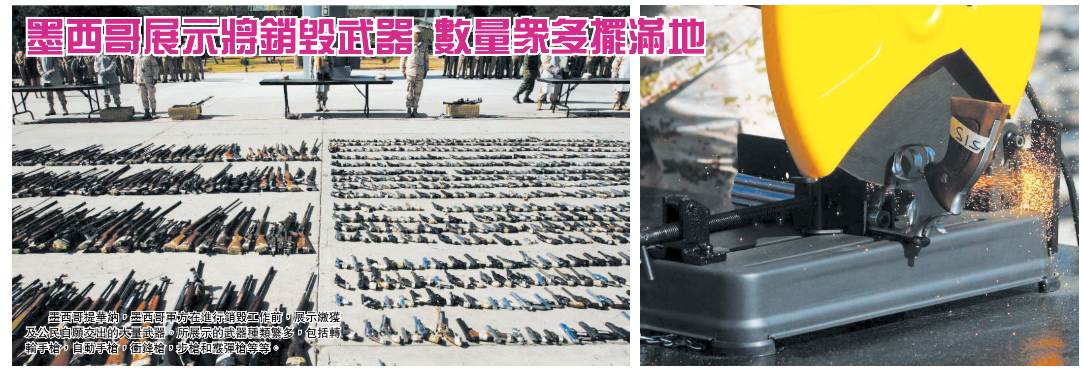
墨西哥展示將銷毀武器 數量眾多擺滿地