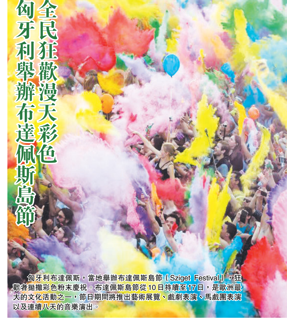
全民狂歡漫天彩色 匈牙利舉辦布達佩斯島節