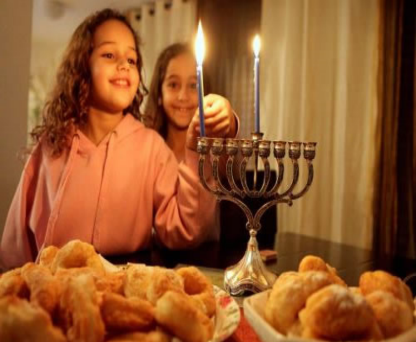
Compiled And Edited By John T. Robbins, Southern Daily Editor

Chanukah is the Jewish eight-day, win- tertime “festival of lights,” celebrated with a nightly menorah lighting, special prayers and fried foods. The Hebrew word Chanukah means “dedication,” and is thus named because it celebrates the rededication of the Holy Temple (as you’ll read below). Also spelled Hanukkah (or variations of that spelling), the Hebrew word is actually pronounced with a guttural, “kh” sound, kha-nu-kah, not tcha-new-kah. In the second century BCE, the Holy Land was ruled by the Seleucids (Syrian- Greeks), who tried to force the people of Israel to accept Greek culture and be- liefs instead of mitzvah observance and belief in G d. Against all odds, a small band of faithful but poorly armed Jews, led by Judah the Maccabee, defeated one of the mightiest armies on earth, drove the Greeks from the land, reclaimed the Holy Temple in Jerusalem and rededicat-