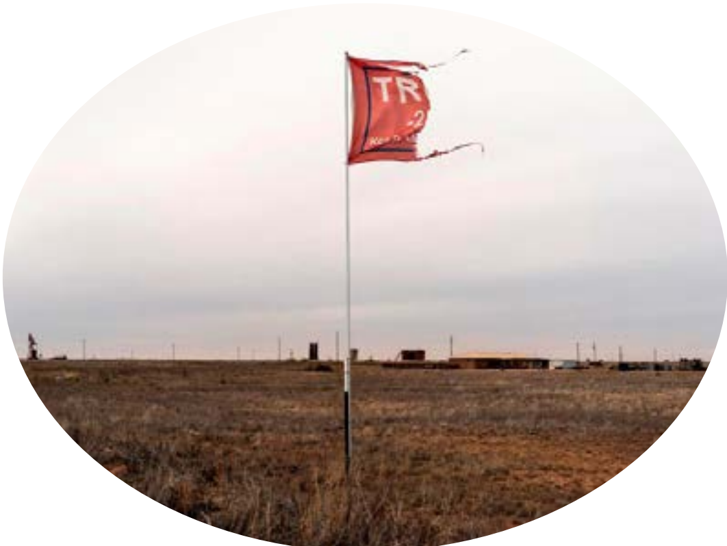
A ripped Trump campaign flag flies in the air on the outskirts of Lamesa, Texas, December 18, 2020.