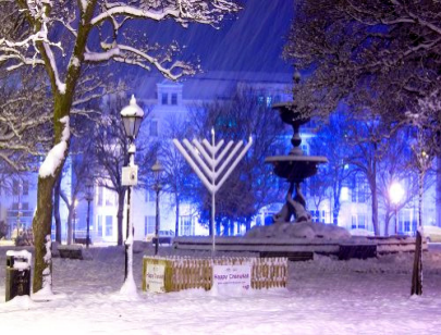
Artist Dominic Alves captured this im- age of a snowy Chanukah in Brighton, UK.

When they sought to light the Temple’s Menorah (the seven-branched candelab- rum), they found only a single cruse of olive oil that had escaped contamination by the Greeks. Miraculously, they lit the menorah and the one-day supply of oil lasted for eight days, until new oil could be prepared under conditions of ritual purity.