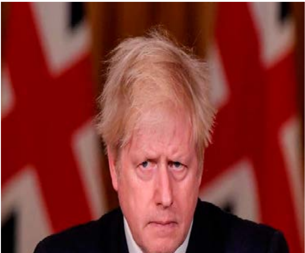
Britain's Prime Minister Boris Johnson looks on during a news conference in response to the ongoing situation with the coronavirus pandemic, inside 10 Downing Street, London, Britain, December 19, 2020.