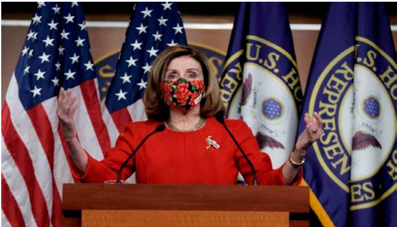
FILE PHOTO: Speaker of the House Nancy Pelosi, D-CA., speaks to reporters on an agreement of a coronavirus disease (COVID-19) aid package on Capitol Hill in Washington, D.C., U.S., December 20, 2020.

The $900 billion pandemic aid package expected to win Congressional approval on Monday will deliver support to a recession-ravaged economy slowing under a deadly coronavirus surge, and set it up for a stronger recovery next year as vaccines become more widely available, economists said.