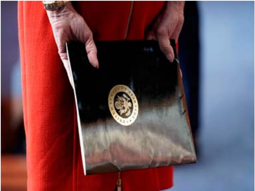
Speaker of the House Nancy Pelosi holds a portfolio as Senate Minority Leader Charles Schumer (not pictured) speaks to reporters on an agreement of a coronavirus aid package on Capitol Hill in Washington, December 20, 2020.