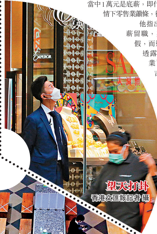
望天打卦

受疫情影響，香港市民消費意慾低迷，他相信情況會持續至明年上半年，直至疫苗廣泛接種，以及旅遊業重新啟動，“現在單靠本地消費者，只是塘水滾塘魚。所以希望政府能夠盡快推出重啟旅遊業的政策，包括健康碼、旅遊氣泡等，協助旅遊業的同時，也拯救零售業。”