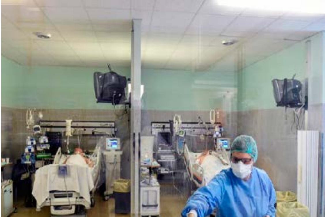
Medical personnel prepare in the emergency room of the Maggiore di Lodi hospital as a second wave of the coronavirus hits the country, in Lodi, Italy, November 13, 2020.