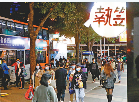
零售業市道蕭條，不少商戶結業離場。