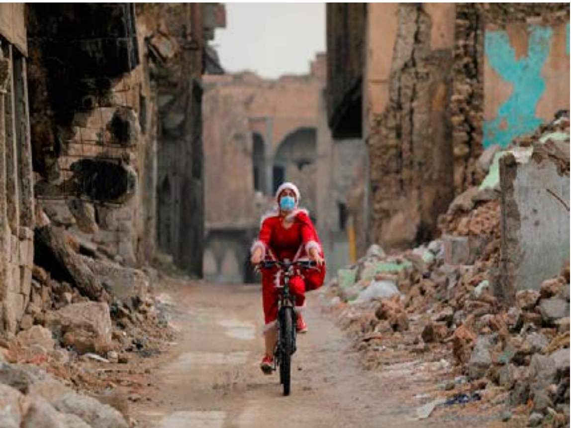
An Iraqi woman, dressed as Santa claus, rides her bicycle in the old city of Mosul, Iraq, December 18, 2020.