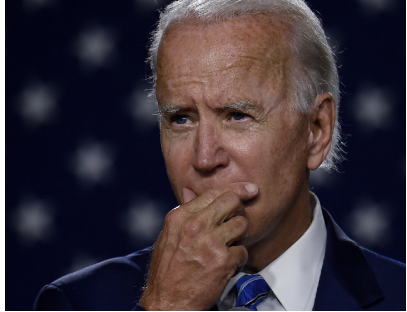
Then presidential candidate Joe Biden speaks at a “Build Back Better” Clean Energy event on July 14, 2020. On Thursday,

Now he has proposed an ambitious $1.9 trillion relief plan that includes $1,400 stimulus checks, additional benefits for the unemployed, as well hundreds of billions of dollars for struggling businesses and local governments.