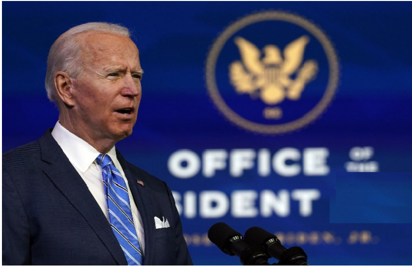
President Joe Biden announces his COVID-19 relief plan in Wilmington, Del.