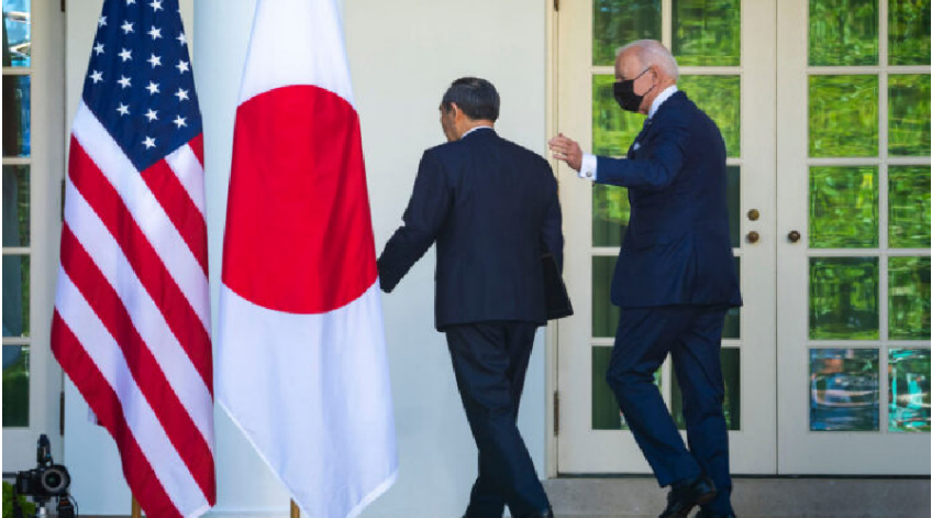
U.S. President Joe Biden (R) and Prime Minister Yoshihide Suga of Japan leave the Rose Garden at the conclusion of a news conference at the White House in Washington, DC. The two leaders met to discuss issues including China, human rights, supply chain resilience and other topics on April 16, 2021.