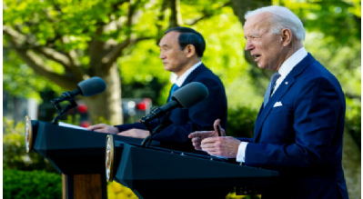
U.S. President Joe Biden (R) and

(GAVI), Epidemic Preparedness Innovations (CEPI), and the World Health Organization (WHO). The platform aims to deliver 1.8 billion doses of vaccine to 30 percent of the population who live in low and middle-income countries. New pledges from countries during the summit saw total donations increase to $9.6 billion to procure and deliver vaccines to developing countries. Previously, the European Union has promised to donate 100 million doses of vaccine, and the United States has pledged to donate 80 million doses.