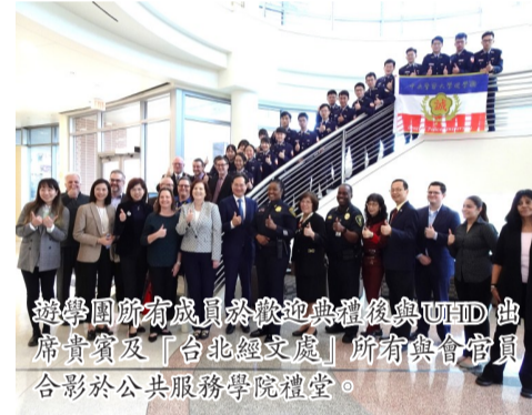
遊學團所有成員於歡迎典禮後與UHD出席貴賓及「台北經文處」所有與會官員合影於公共服務學院禮堂。