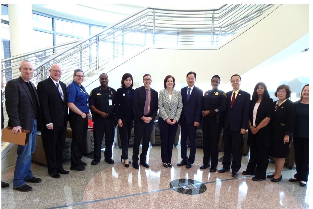
國府「台北經文處」出席官員們與UHD各部門負責人在會後合影。