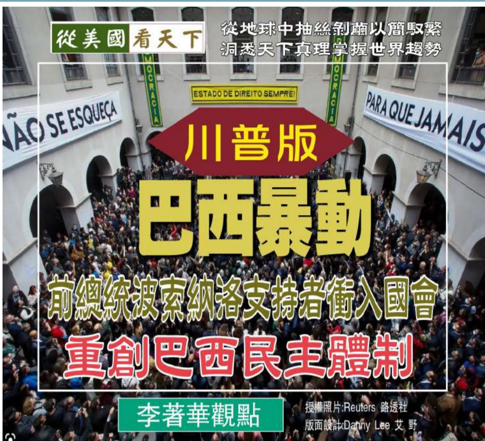
李著華觀點 版面設計: Danny Lee 艾野

波索納洛是一名近乎法西斯的極端右翼分子，他否認自己煽動了這次的騷亂，並投機取巧逃到了佛州，顯然是為了讓自己擺脫巴西司法的制裁，他的支持者一直要求巴西軍方發動政變推翻拉達，他們錯誤地稱拉達為“共產主義者”，到目前為止，巴西的國家權力平衡已經倒向了民主一邊，這個國家在20世紀80年代之前一直忍受軍事獨裁。幾乎沒有跡象表明國際社會支持波索納洛的政變，這位目前躲在佛羅里達的流亡者必需接受巴西的國法制裁，因為民主需要法治力地捍衛自己！