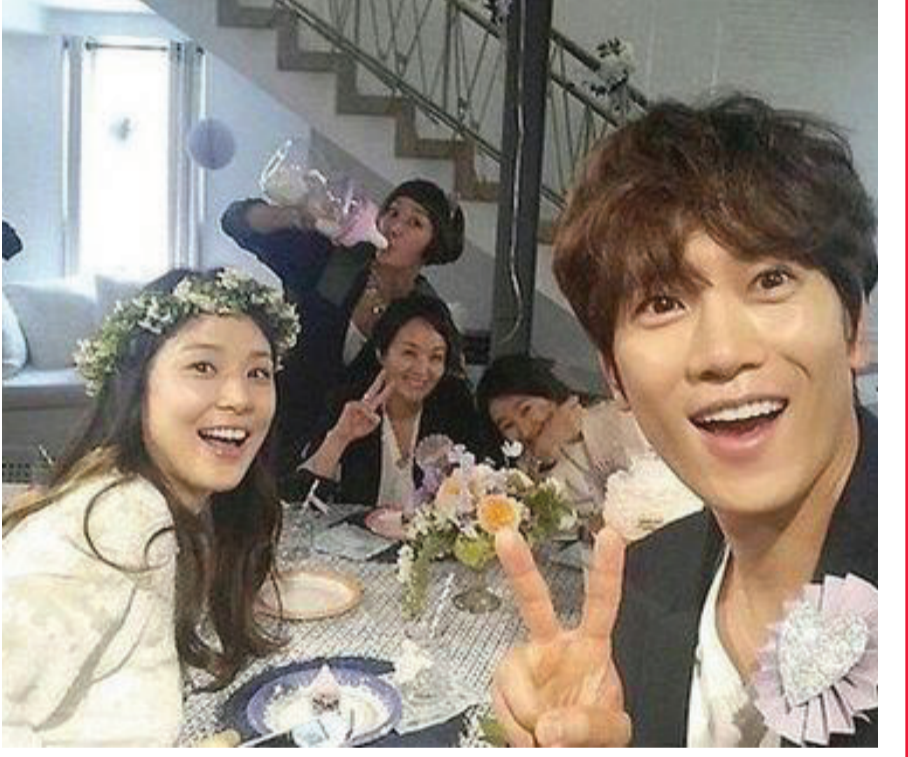
池城和李寶英於2013年9月結婚，李寶英去年秋天懷孕，將於6月產下第一個寶。

綜合報導 韓國女演員李寶英準備當媽，好友卞貞秀今日上午在網上曬出多張池城與李寶英夫婦舉辦歡迎寶派對的照片，現場氣氛喜慶。據報導，池城和李寶英夫婦的好友裴宗玉、尹賢淑、卞貞秀、張熙珍均到場表示祝福，並帶來各種可愛小物裝飾好現場，然後等待李寶英登場。