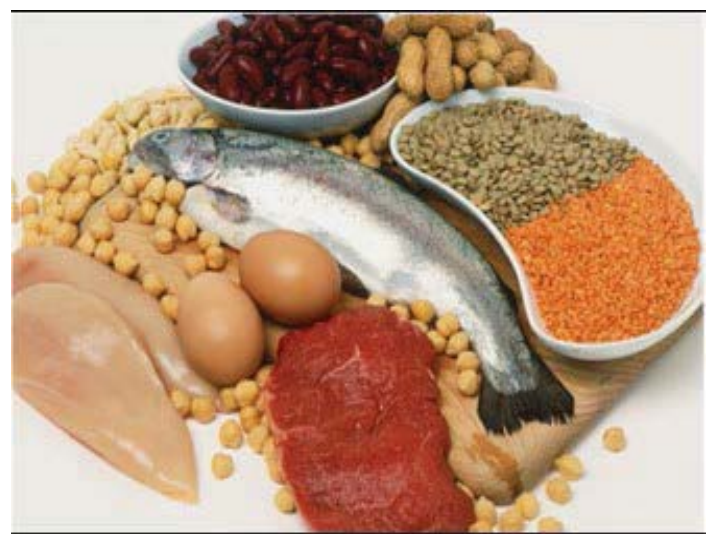
No genetically modified Staple foods such as meats, eggs, milk or seafood are allowed in commercial production in China.

To be competitive and enhance its soft-power influence, China must "occupy a commanding height in this technology", he said. (Courtesy http://www.chinadaily.com.cn/china)