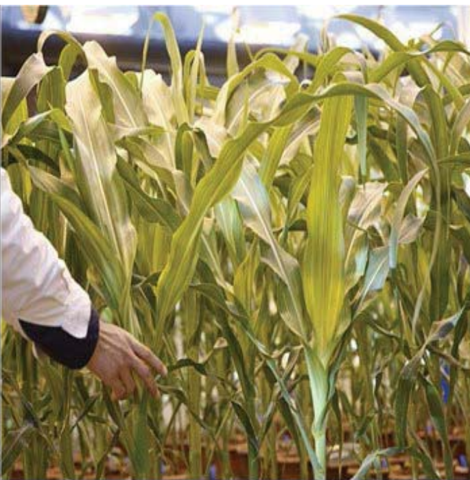
A researcher checks on corn plants in a greenhouse cultivating national corn and genetically modified corn in Syngenta Biotech Center in Beijing, China, Feb 19, 2016. Picture taken February 19, 2016.

Compiled And Edited By John T. Robbins, News&Review Editor