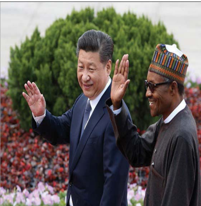
China's President Xi Jinping and Nigerian President Muhammadu Buhari greet primary school students after reviewing an honor guard during a welcoming ceremony at the Great Hall of the People in Beijing last Tuesday.