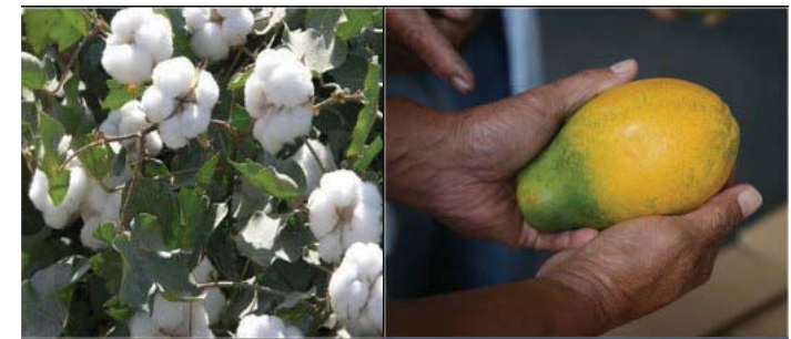
So far, China has approved only the production of GM cotton and papaya.

China's agricultural authorities have to approve GM grains before they can be marketed.