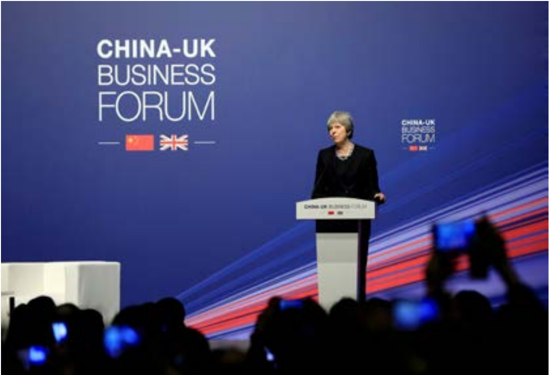
British Prime Minister Theresa May speaks at the China-UK business forum in ShanBritain’s Secretary of State for Exiting the European Union David Davis arrives in Downing Street, London