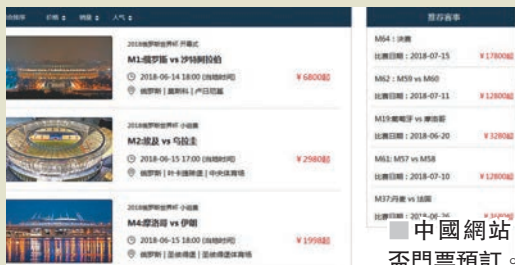
中國網站已推出世界盃門票預訂。