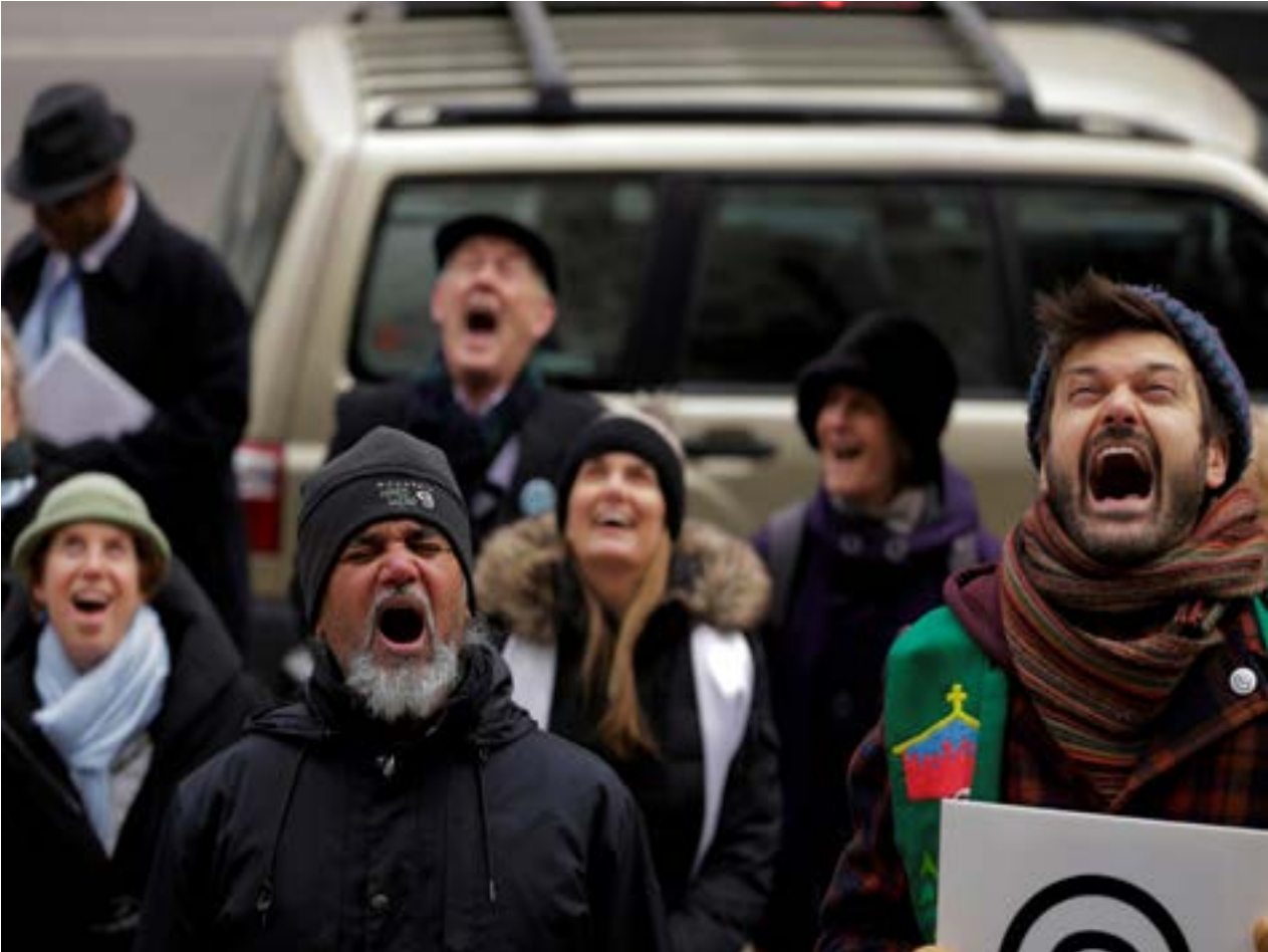
Immigration activist Ravi Ragbir leads a protest outside of a federal building in New York