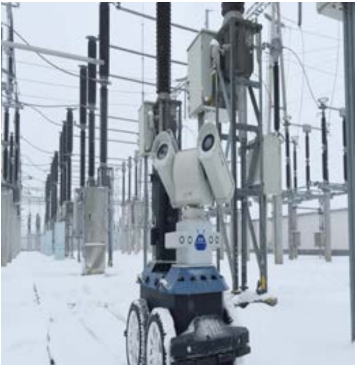
Robot inspects power equipment at an electrical substation in Chuzhou