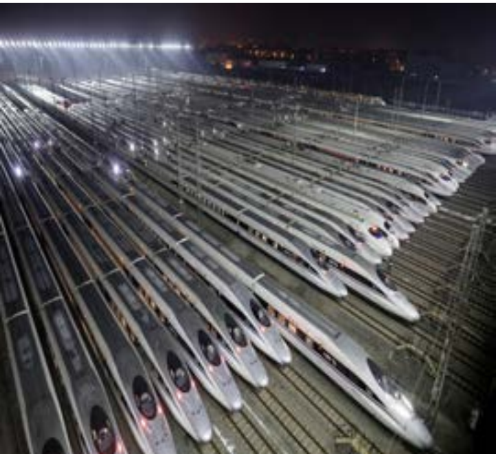
China Railway High-speed Harmony bullet trains are seen at a high-speed train maintenance base, as the Spring Festival travel rush begins, in Wuhan