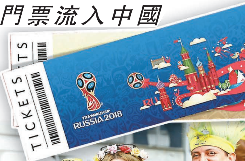
■4年前，不少中國球迷赴巴西觀看世界盃。資料圖片