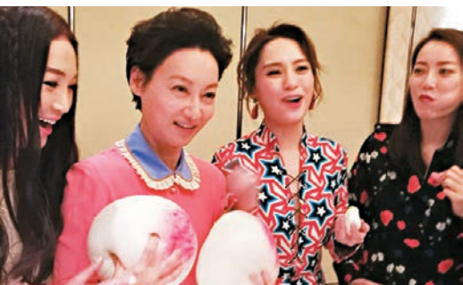
壽星女惠英紅(左二)拿着壽包惡搞一番。

提到會否和阿Sa（蔡卓妍）一齊辦婚禮，這不是很好嗎？阿嬌說：“大家有想過，但我不可代她答，大家去問她吧，人家都要去Plan的。還有，我們平時不會傾感情事，要講自己就會講的。”