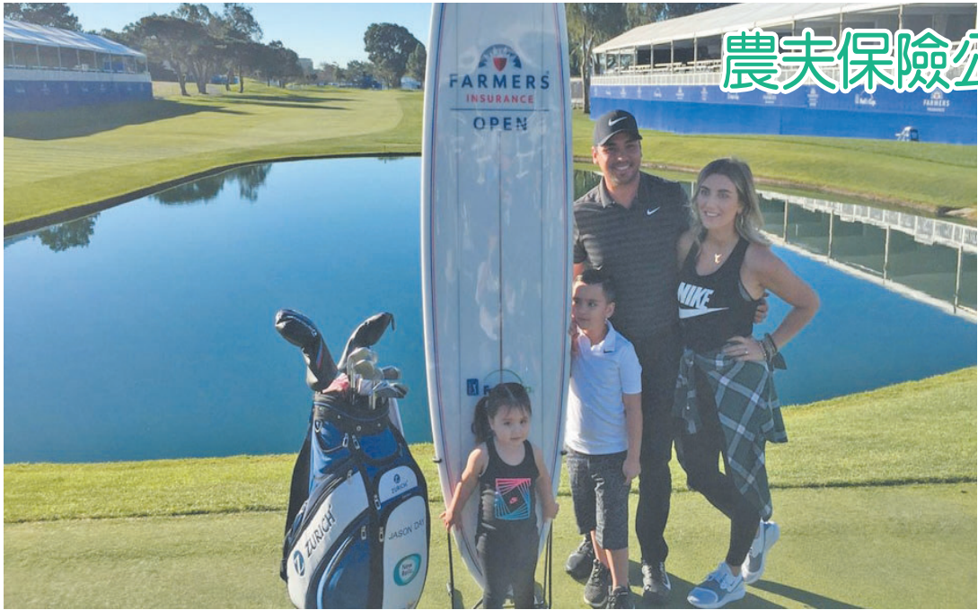
農夫保險公開賽戴伊奪冠