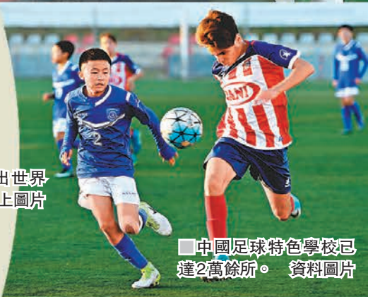
■中國足球特色學校已達2萬餘所。資料圖片