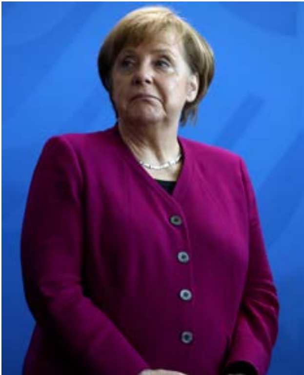
Presentation of a new 2 Euro commemorative coin which bears former German Chancellor Schmidt