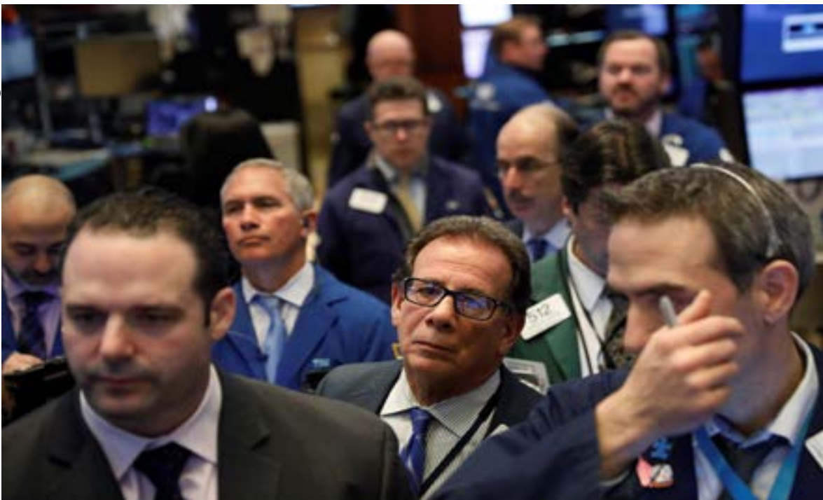
Traders work on the floor of the New York Stock Exchange shortly after the opening bell in New York

Declining issues outnumbered advancers on the NYSE by 2,504 to 432. On the Nasdaq, 2,237 issues fell and 672 advanced.