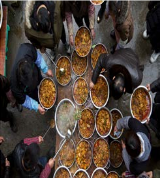
Villagers prepare a meal after slaughtering pigs, during a celebration ahead of the Lunar Chinese New Year, in Anshun