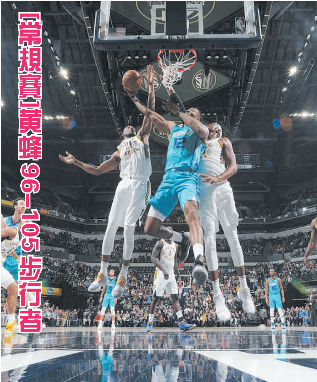
常規賽「黃蜂」96-105 步行者