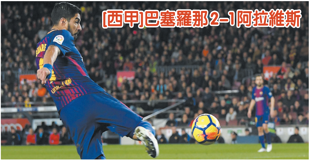
〔西甲〕巴塞羅那2-1阿拉維斯