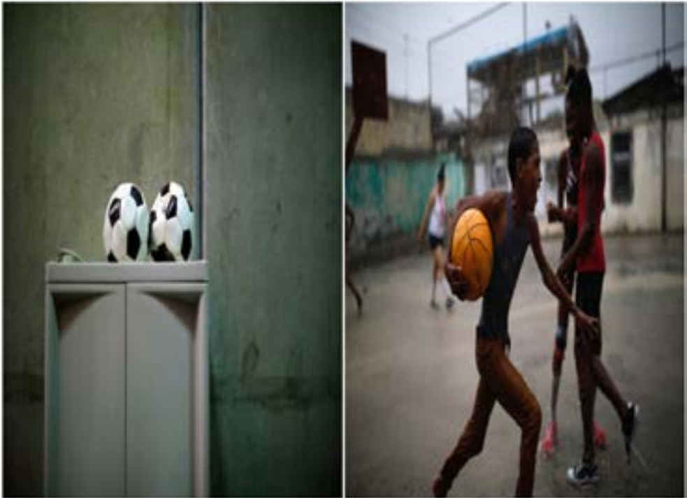
combination picture shows soccer balls inside a cellblock at the U.S. Naval Base in Guantanamo Bay, Cuba, June 3, 2017 (L) and a boy running with a ball during a soccer game in the city of Guantanamo, Cuba, December 6, 2017.