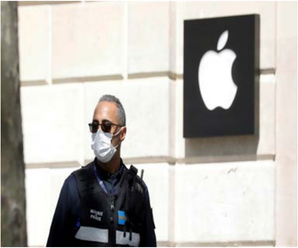
Outbreak of the coronavirus disease (COVID-19), in Paris