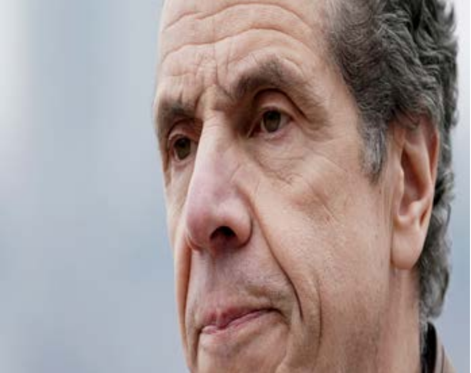
FILE PHOTO: New York governor Andrew Cuomo speaks as the USNS Comfort pulls into a berth in Manhattan during the outbreak of coronavirus disease (COVID-19), in the Manhattan borough of New York City