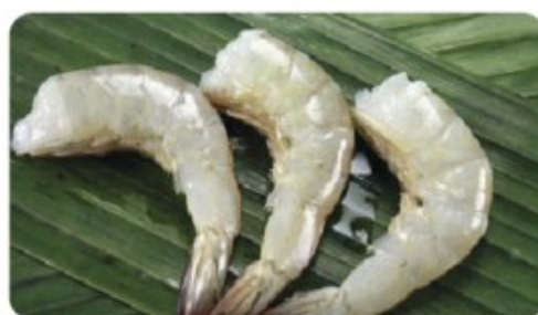
26/30 H/L SHRIMP