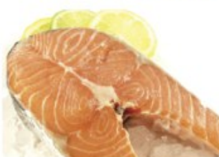
FRESH SALMON STEAK