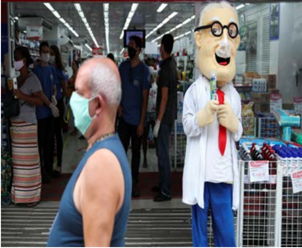
Outbreak of the coronavirus disease (COVID-19), in Rio de Janeiro