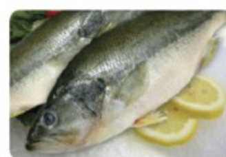
FRESH BIG MOUTH BASS