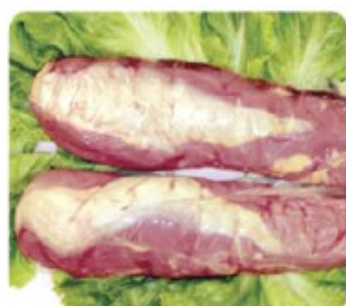
BEEF FILLET MIGNON 4UP