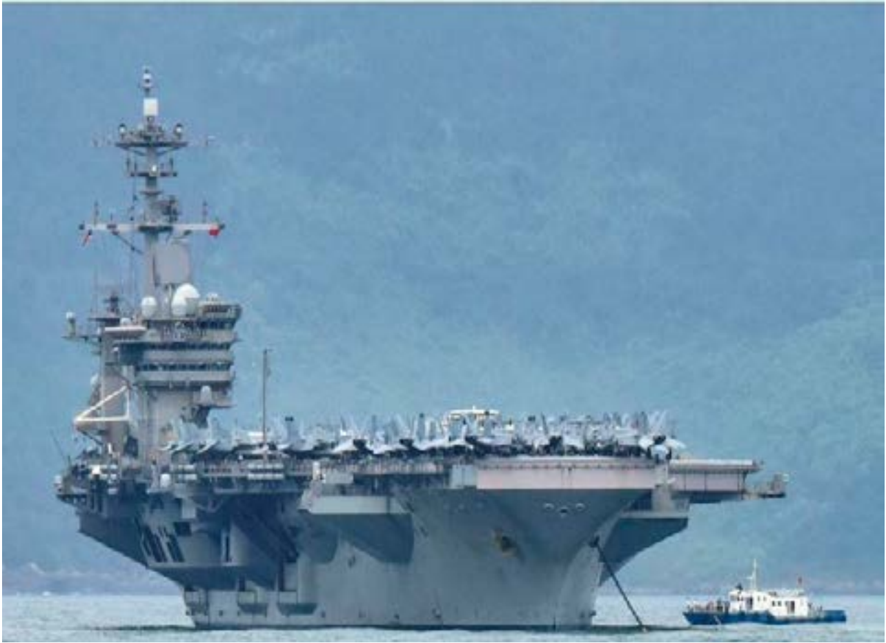
FILE PHOTO: The aircraft carrier Theodore Roosevelt (CVN-71) is pictured as it enters the port in Da Nang, Vietnam, March 5, 2020. REUTERS/Kham/File Photo

'DISCONCERTING' DATA FOR PENTAGON Defense Secretary Mark Esper, speaking in a television interview on Thursday, said the number of asymptomatic cases from the carrier was "disconcerting."