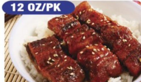
BBQ EEL UNAGI