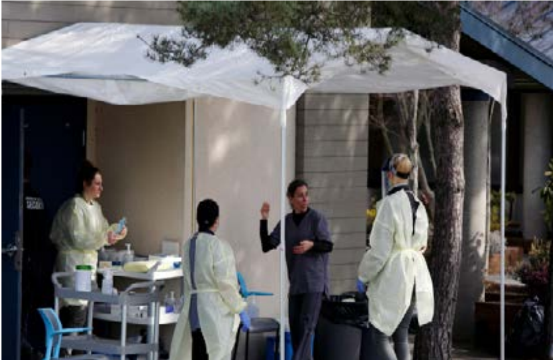
Medical staff assess for COVID-19 at public Victoria Health Unit, BC