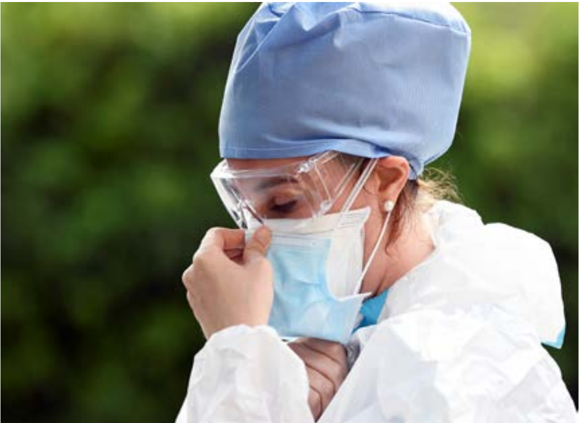
Doctors visit patients at home amid the coronavirus disease (COVID-19) outbreak in Bergamo