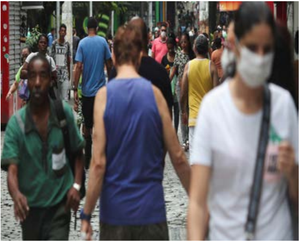
People, some wearing protective masks, walk at a commercial center during the coronavirus disease (COVID-19) outbreak in Rio de Janeiro, Brazil April 16, 2020.