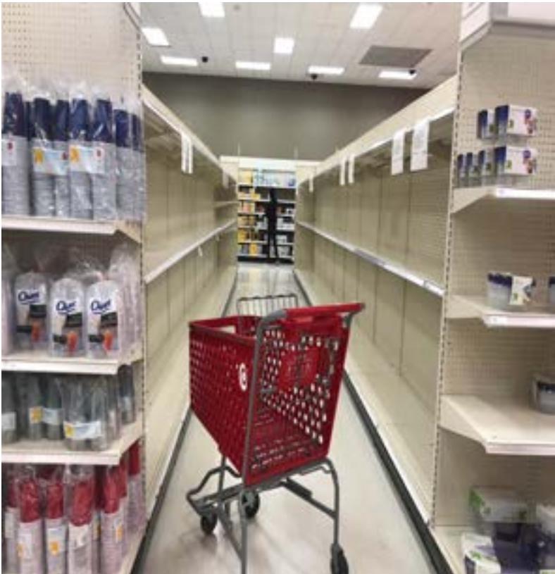
FILE PHOTO: An abandoned shopping cart lies between empty paper towel aisles at a Target store in Culver City