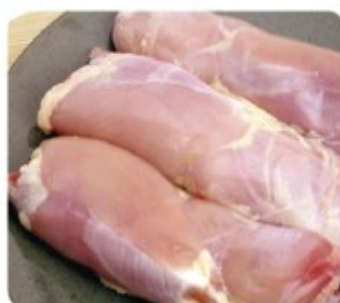
CHICKEN LEG MEAT