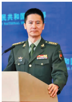
中國國防部新聞發言人譚克非

香港文匯報訊（記者 葛沖 北京報道）繼本月23日美軍艦擅闖中國西沙領海被驅離後，24日美軍艦再次擅闖中國西沙領海被警告驅離。中國國防部新聞發言人24日就此發表談話指出，中方嚴正要求美方立即停止此類挑釁行徑，否則美方將承擔由此引發不測事件的嚴重後果。他說，解放軍將採取一切必要措施，堅決捍衛國家主權和安全，堅決維護南海地區和平穩定。專家指出，美國頻繁生事旨在維護其在亞太地區的霸權利益、遏制中國發展，相信解放軍有足夠能力、信心和決心捍衛國家主權與安全。