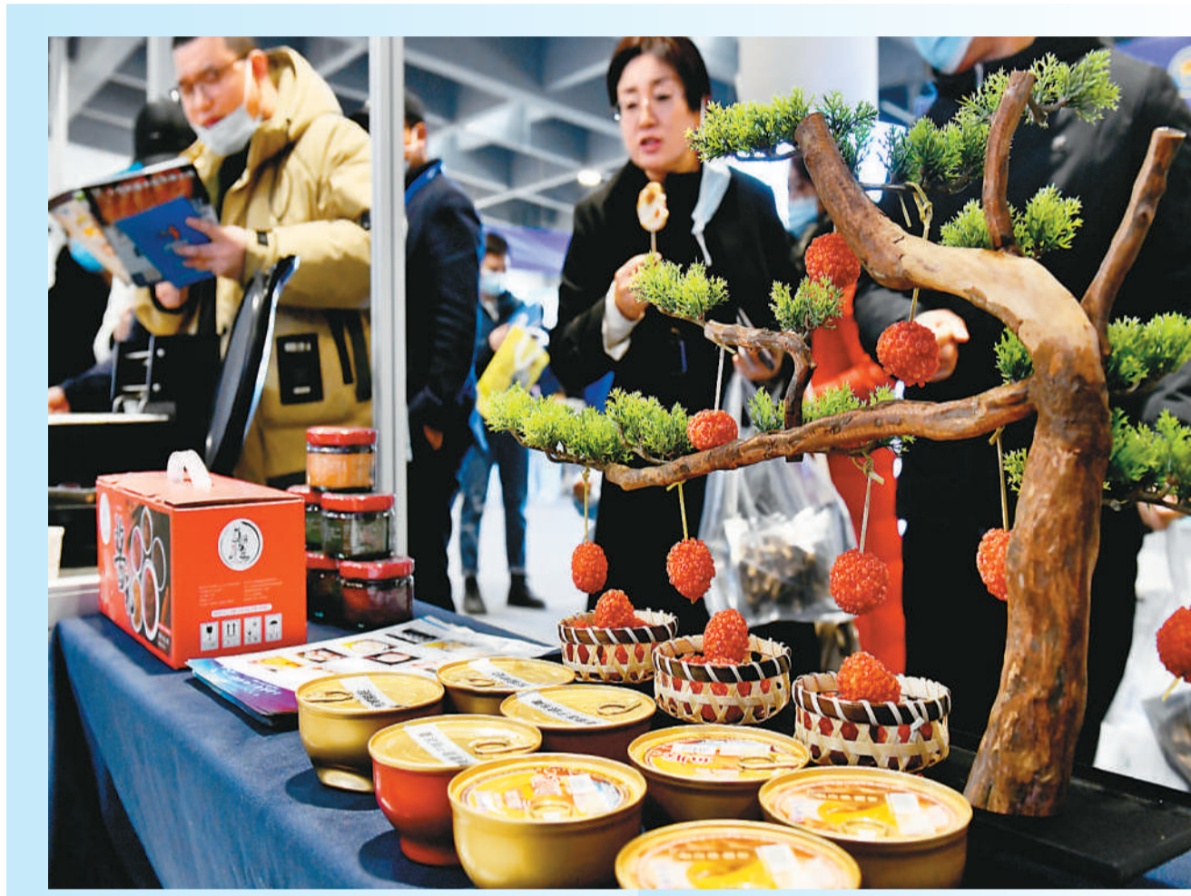
2月24日，2023中国（日照）海洋食品预制菜发展大会举行，来自各地的海洋食品预制菜亮相。图为市民在博览会上参观。

挖核……罐头加工是典型的劳动密集型产业，人工需求量很大，同时也面临成本上涨的挑战，但技术创新带来改变。