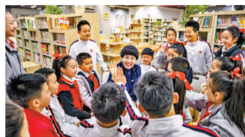
2月24日，在重慶市九龍坡區謝家灣學校，校長（中）與學生們聊天之前擊掌迎接新學期的到來。

《管理辦法》對校外培訓機構財務活動提出了全面規範要求。一是資金籌集方面，明確了舉辦者的出資義務和不得抽逃出資的要求，同時禁止上市公司、外商投資義務教育階段學科類培訓機構，禁止中小學校舉辦或參與舉辦培訓機構。二是資金營運方面，對校外培訓機構收入歸口、預收費監管、合同簽訂和退費做出規定，強調其融資及培訓服務費收入應主要用於培訓業務，要建立大額資金支付決策制度，明確大額資金支出的程序、方式、規則。三是資產和負債管理方面，強調要維護資產安全與完整，禁止非營利性培訓機構對外提供擔保，明確培訓機構申請貸款的使用方向，建立債務風險預警機制。四是收益分配方面，明確了培訓機構淨資產（利潤）的使用與分配方式，強調非營利性培訓機構舉辦者不得分紅或取得其他投資收益。五是財務清算方面，規定了培訓機構的清算情形、清算