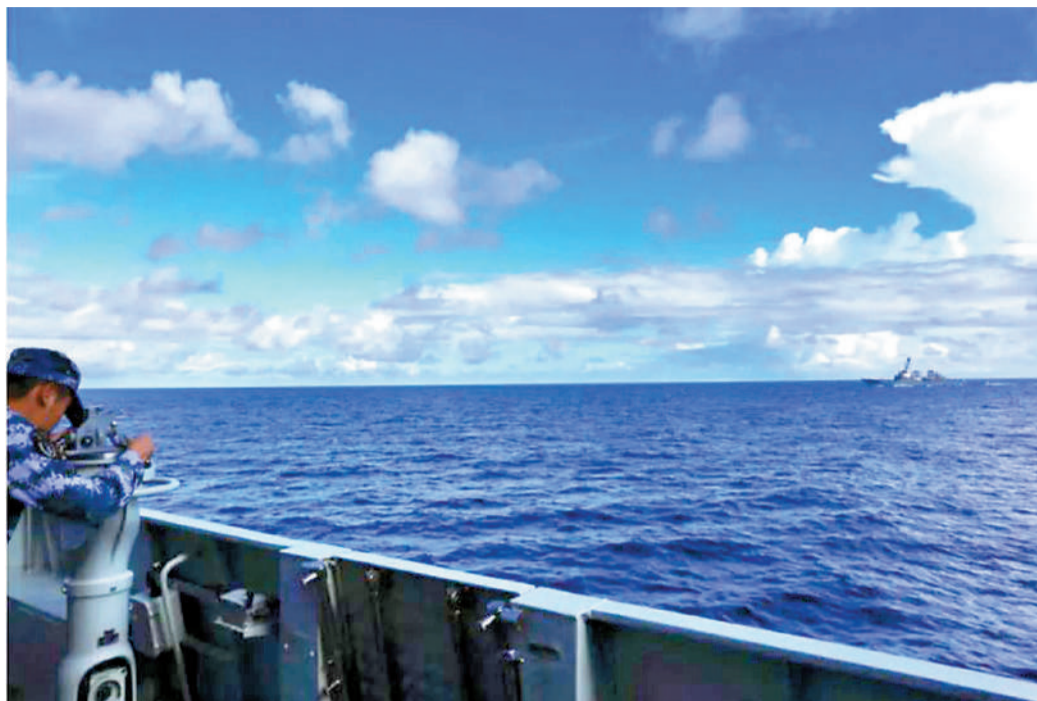
3月24日，美“米利厄斯”號導彈驅逐艦未經中國政府批准，再次非法闖入中國西沙領海，破壞南海地區和平穩定，中國人民解放軍南部戰區依法進行跟蹤監視，並予以警告驅離。圖為早前解放軍組織海空兵力對闖入中國西沙領海的美“本福德”號導彈驅逐艦予以警告驅離。

3月24日，美“米利厄斯”號導彈驅逐艦未經中國政府批准，再次非法闖入中國西沙領海，破壞南海地區和平穩定。中國人民解放軍南部戰區依法進行跟蹤監視，並予以警告驅離。國防部新聞發言人譚克非就此發表談話指出，美軍行徑嚴重侵犯中國主權和安全，嚴重違反國際法，是其大搞航行霸權、製造南海“軍事化”的又一鐵證。“我們嚴正要求美方立即停止此類挑釁行徑，否則美方將承擔由此引發不測事件的嚴重後果。中國人民解放軍將採取一切必要措施，堅決捍衛國家主權和安全，堅決維護南海地區和平穩定。”