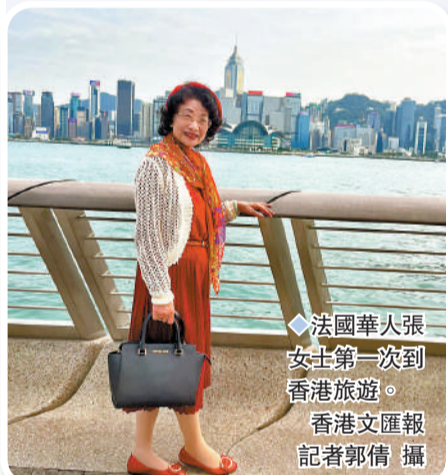
◆法國華人張女士第一次到香港旅遊。