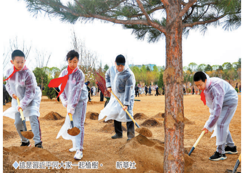
這是習近平同大家一起植樹。