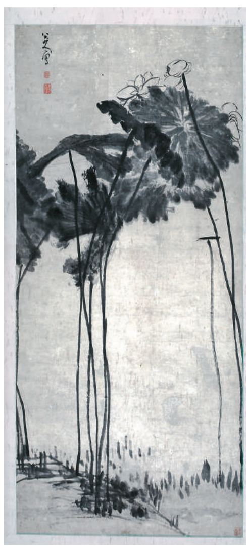
左图：八大山人绘《双鹰图轴》。右图：八大山人绘《墨荷图轴》。

眼帘：面容清癯，神情冷逸，双手环抱于胸前，斜跨斗笠。这是雕塑家唐大禧1986年为纪念八大山人诞辰360周年创作的。