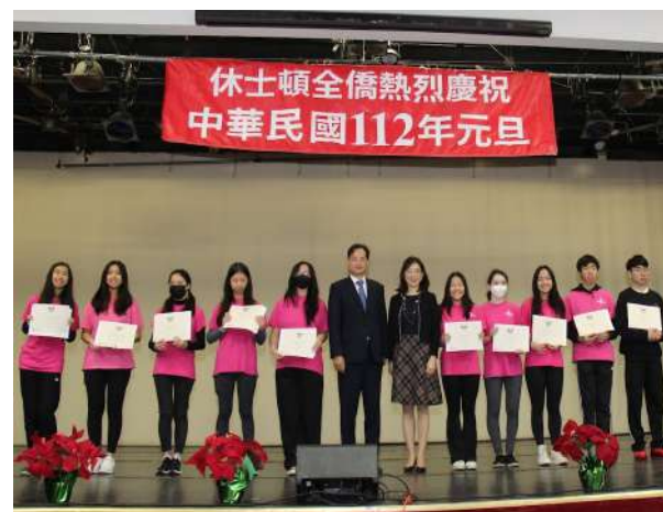
頒發休士頓地區「青年文化大使協會」(FASCA)美國總統志工獎。