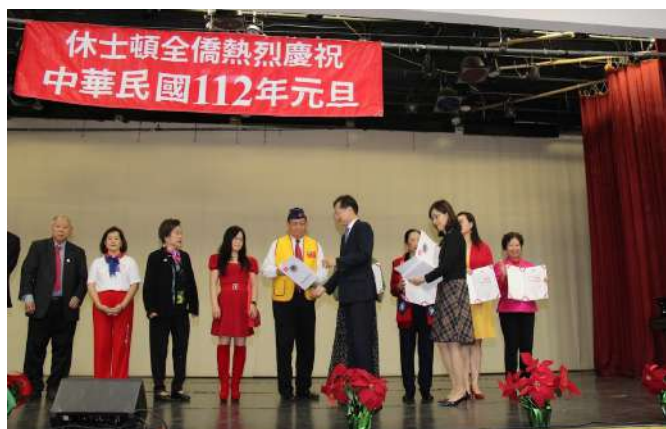
國慶活動有功人員頒獎。