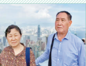
北京郭阿姨夫婦幾年前遊覽太平山時的合影。