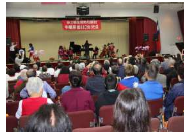
近三百僑胞出席新年茶會。