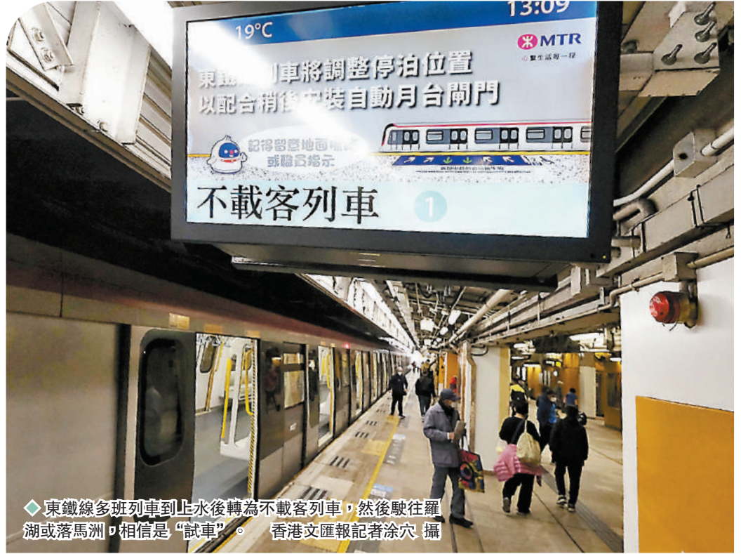
東鐵線多班列車至上水後轉為不載客列車，然後駛往羅湖或落馬洲，相信是“試車”。

據悉，政府計劃設網上取籌系統，登記人要預先選定口岸，不能在過關時才決定；名額要在網上申請，初步傾向“先到先得”，意味或不設優先群組名額。