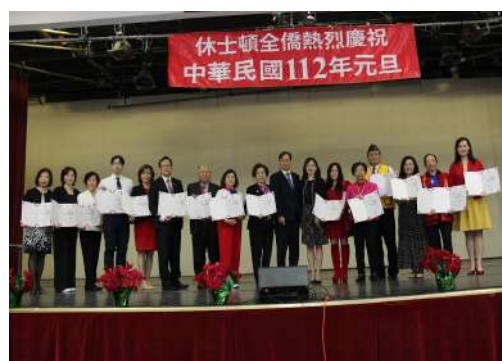
全體獲獎人員大合照。