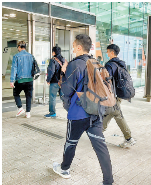
西九龍高鐵路3日有工作人員出入。

香港與內地免檢復常通關在即，香港大學醫學院公共衛生學院教授潘烈文3日接受電台節目訪問時表示，根據內地公開有關變異病毒株的數據，未觀察到有異樣，現時內地流行的BF.7及BA.5.2病毒株，與香港及海外流行的相若，無證據顯示內地流行的新冠病毒造成更重病情，兩地復常通關對香港構成的疫情風險不大。