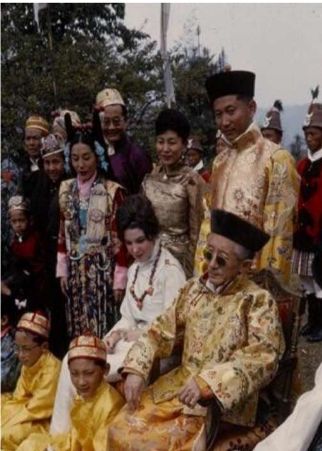
锡金第11任国王塔西南嘉（前排左一）与王储、王储妃、公主们

中国拒绝承认印度对锡金的主权，在中国的中学课本上，锡金也作为主权国家标注于世界地图，直到2003年。当年印度总理访华，两国达成一致：中国承认锡金属于印度，印度承认西藏属于中国。自2005年起，中国中学课本的世界地图上不再有锡金。锡金王室随风而去，成为喜马拉雅山脚下的绝美回忆。