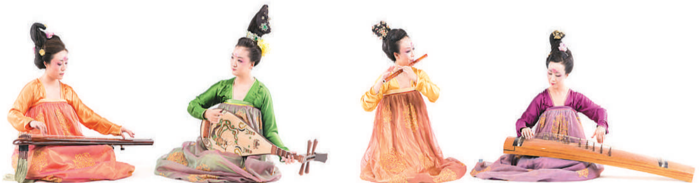
▲ 河南博物院华夏古乐团唐代乐舞俑、服饰复原重构。