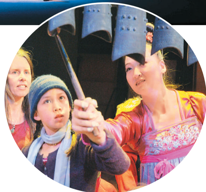
▲ 河南博物院华夏古乐团赴美国访问交流演出期间，观众在体验古代乐器。

此外，华夏古乐团还承担了国家文化科技创新工程“华夏古乐的数字化传播与应用”等项目，在数字化传播与应用上进行了诸多尝试。比如，“乐吟元夕——2022年华夏古乐专题音乐会”通过网络进行直播，让更多网友感受到中华传统文化的魅力；“云端古乐厅”为古音乐插上“云”翅膀……在技术的加持下，华夏古乐新声传扬得更加悠远。