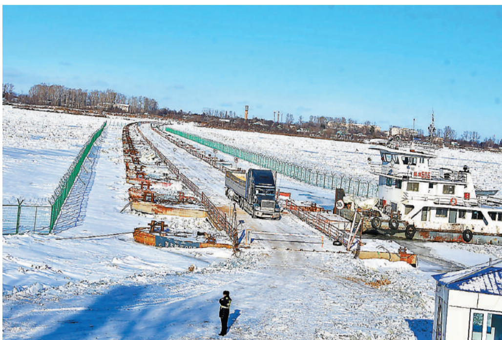
首輛從俄羅斯駛過浮箱固冰運輸通道的貨車裝載了22噸大豆。

中俄浮箱固冰運輸通道每週運行時間是周一至周六，每日北京時間7點到下午3點30分運行，預計到2023年4月初結束，過了溜冰期5月份，企業貨物就可以走水運。一般企業履行相關