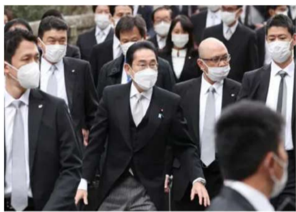
(綜合報導) 近期，日本政壇可謂是消息不斷。日本政府剛剛放出日本首相岸田文雄即將訪美的消息，然而，令所有人沒有想到的是，岸田文雄新年的第一站，就遭遇了“炸彈威脅”。

據環球網報導，按照日本以往的慣例，在每年的新年假期結束之後，日本首相第一件大事就是前往三重縣參拜伊勢神宮。當然，今年也不例外。不過，據消息人士透露，岸田文雄在抵達伊勢神宮之前，現場突然傳出了巨大爆炸聲，而且還不止一聲。所幸沒有造成人員傷亡，虛驚一場。 事情發生之後，日本警方第一時間對現場進行了搜捕，並在附近的草叢裡發現了大量爆竹殘骸、電線以及類似天線等可疑物品，所以日本警方懷疑可能是有人遠程遙控引爆。 更重要的是，日本警方在上午排査時並沒有出現這些可疑物品，因此警方推測可能是在安檢後才設置的，當然也不排除日本警方檢查疏漏的可能。可見，這件事不簡單。 要知道，在去年日本前首相安倍晉三遇刺身亡之後，日本警方就全面升級對重要人物的