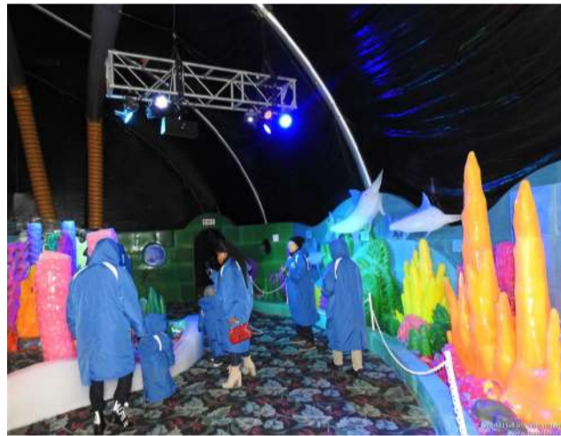
Moody Garden 每年聖誕新年期間展覽的中國哈爾濱冰雕 Ice-land 今年主題是加勒比海聖誕，遠近各城市的住慣南方亞熱帶極少見到冰雪的孩子們此時可以在父母帶領下領略零下 17 度的冰天雪地，華人華僑也可以藉此一解鄉愁，在新年到來之際觀瞻中華文明的足跡，截止日期是 2023 年 1 月 7 日