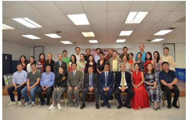
由中國人活動中心聯手大休斯敦地區 60 多家社團共同舉辦的 2023 年兔年新春聯歡晚會籌備工作穩步進行，節目選定，大咖雲集，值得期待，票務銷售也正式展開。圖為 2022 年 12 月 11 日舉行的第二次新聞發布會上，主辦單位、主創團隊和出席僑領全體合影，歡迎致電中國人活動中心和各大社團訂購