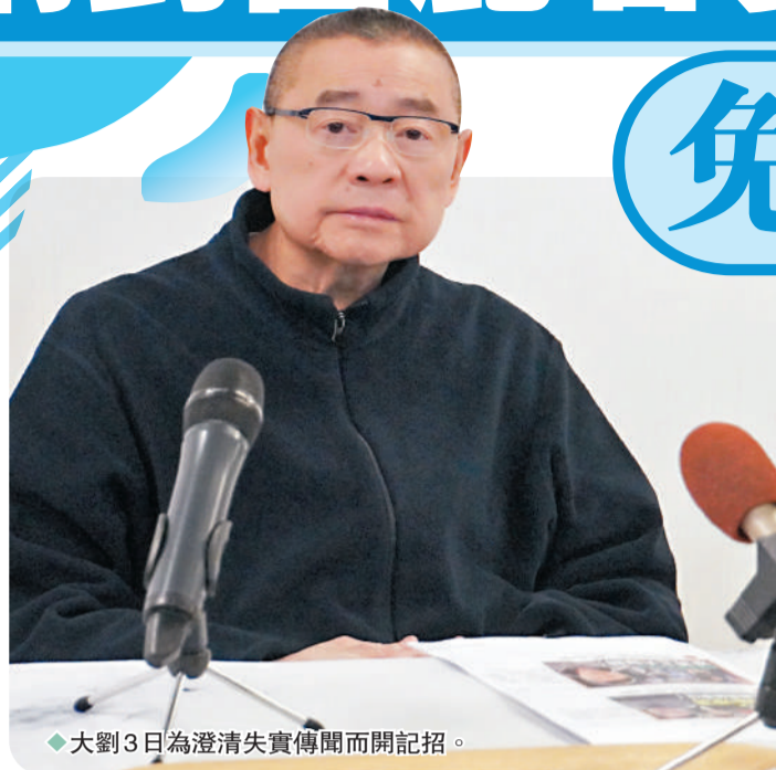
大劉3日為澄清失實傳聞而開記招。