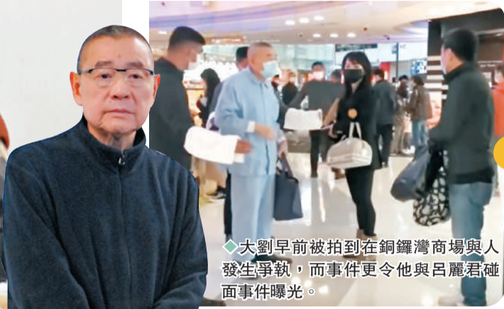
大劉早前被拍到在銅鑼灣商場與人發生爭執，而事件更令他與呂麗君碰面事件曝光。

香港文匯報訊（記者子棠）劉鑾雄繼日前發聲明否認與前女友呂麗君（現改名呂佩霖）復合後，3日早再就事件舉行記者會，並認為有人以“有機心”來形容呂麗君是太膚淺，暗示已準備好長期作戰，而他又提到今次出手相助是要維護一對子女的尊嚴；更直指多年來在圈中的緋聞女友幾乎沒有一個是好人，又為多年前的“The One”和“春卷”傳聞解迷思！