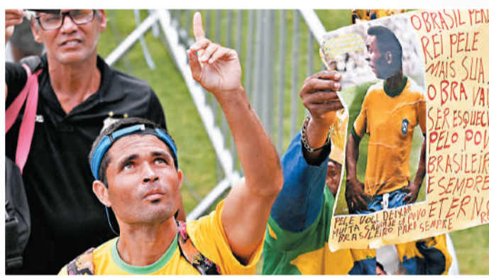
有球迷指向上天，希望比利在天之靈能收到自己的心意。