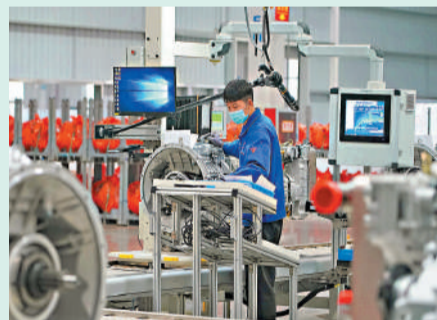
財新中國製造業採購經理人指數跌至49，低於11月0.4個百分點，連續五個月收縮且降幅擴大。