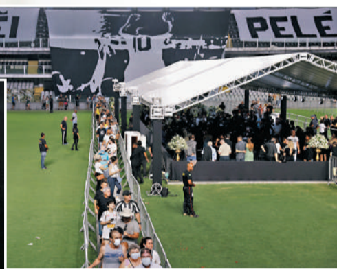
人們等候瞻仰球王遺容。