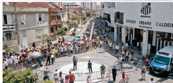
山度士主場外出現長長的人龍。