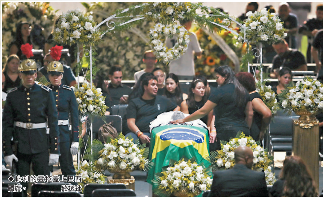
比利的靈柩蓋上巴西國旗。

巴西當地時間1月2日，“球王”比利的葬禮在聖保羅州桑托斯市舉行，家人將遵照比利生前遺願，將他安葬在全球最大的“垂直公墓”。據估計，比利追悼會的參與者多達數十萬人，外媒報道到場弔唁的人龍一度長達超過2.5公里，民眾們都希望為這位一代足壇傳奇作最後的送別。