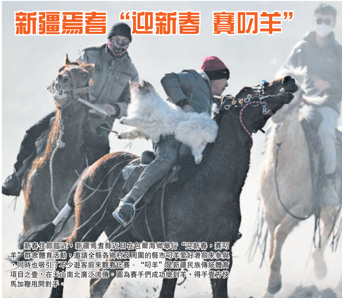
新春佳節臨近，新疆焉耆縣近日在包爾海鄉舉行“迎新春，賽叨羊”群眾體育活動，邀請全縣各鄉村及周圍的縣市叨羊愛好者前來參與，同時也吸引了不少遊客前來觀看比賽。“叨羊”是新疆民族傳統體育項目之壹，在天山南北廣泛流傳。圖為賽手們成功搶到羊，得手壹方快馬加鞭甩開對手。