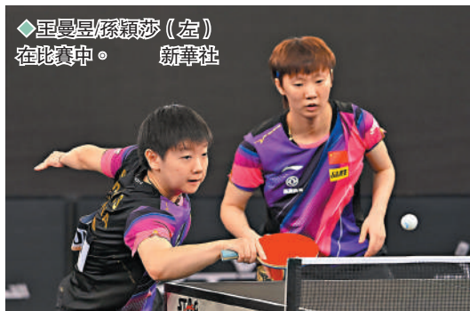
◆孫穎莎(左)在比賽中。