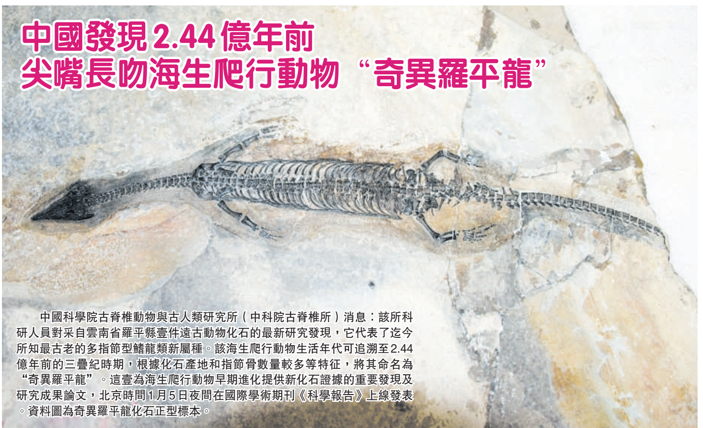
中國科學院古脊椎動物與古人類研究所（中科院古脊椎所）消息：該所科研人員對采自雲南省羅平縣壹件遠古動物化石的最新研究發現，它代表了迄今所知最古老的多指節型鱗龍類新屬種。該海生爬行動物生活年代可追溯至 2.44 億年前的三疊紀時期，根據化石產地和指節骨數量較多等特征，將其命名為“奇異羅平龍”。這壹為海生爬行動物早期進化提供新化石證據的重要發現及研究成果論文，北京時間 1 月 5 日夜間在國際學術期刊《科學報告》上線發表。資料圖為奇異羅平龍化石正型標本。