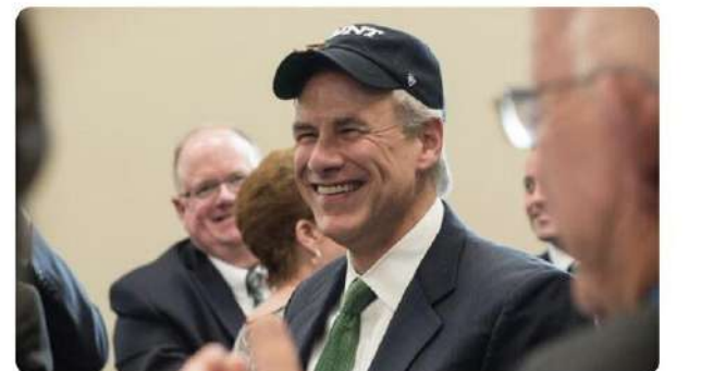
Texas Governor Greg Abbott.

Governor Abbott's administration is tabling a bill that will see foreign entities banned from purchasing land across Texas.