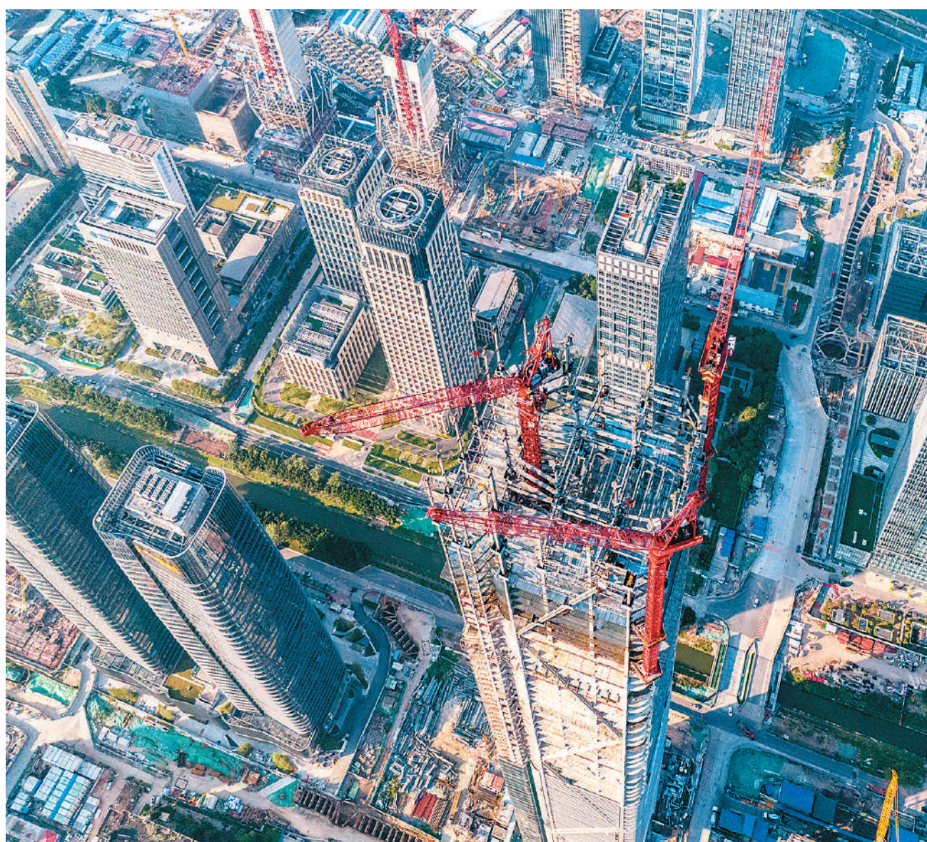
2021年，广东省广州市服务业增加值超2万亿元，占全市地区生产总值比重七成以上，在商贸服务、科技服务、金融服务等领域优势明显。图为2022年12月初，初具规模的广州市琶洲高新区。

多年来，服务业一直是中国吸引外资增长的“主引擎”。“十三五”时期，中国服务业吸收外资