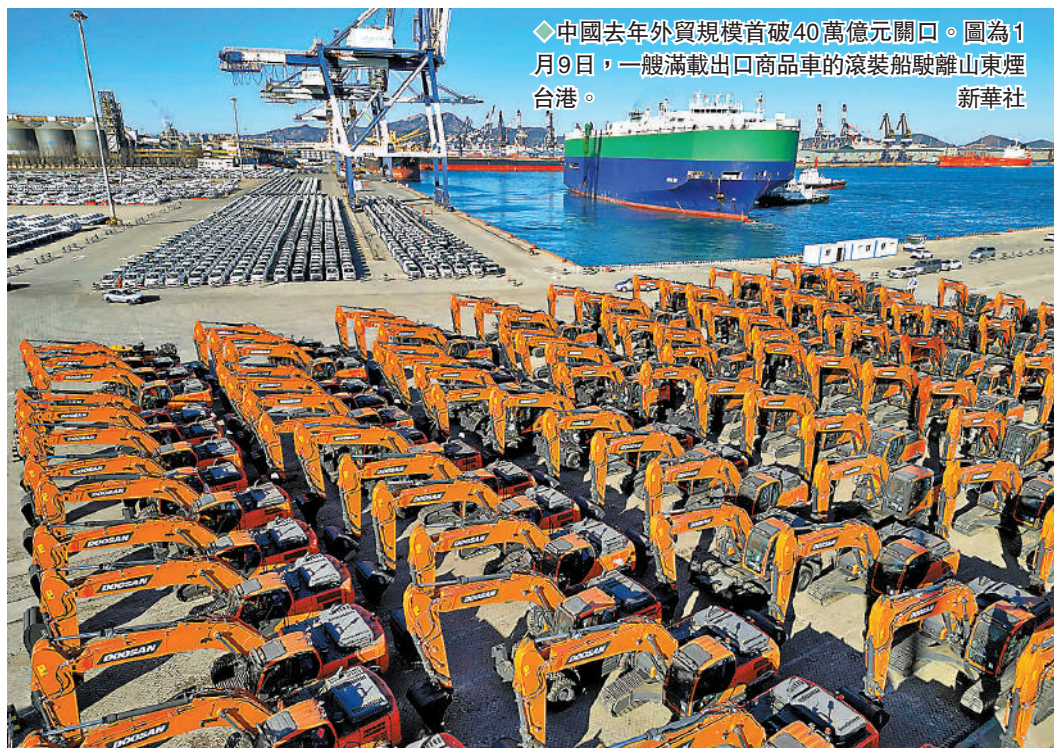
◆中國去年外貿規模首破40萬億元關口。圖為1月9日，一艘滿載出口商品車的滾裝船駛離山東煙台港。

展望2023年外貿形勢，呂大良表示，當前中國經濟恢復的基礎尚不牢固，外部環境動盪不安，世界經濟下行壓力不斷加大，外貿發展面臨的困難挑戰仍然較多。正視這些困難挑戰的同時，也要看到中國經濟韌性強、潛力大、活力足，長期向好的基本面依然不變，經濟有望總體回升，推動外貿穩規模、優結構具有堅實支撐。