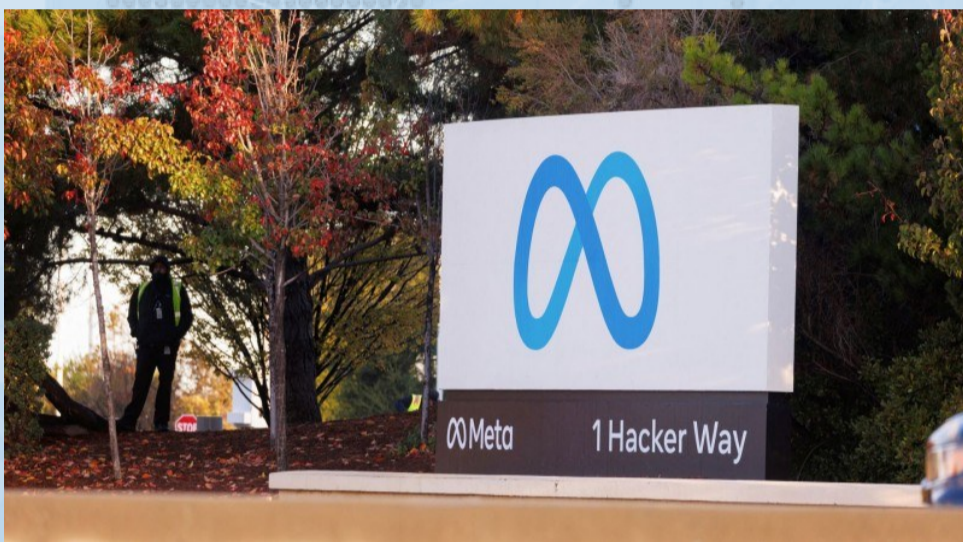
Today the heads of tech companies need to serve their stockholders to cut costs. It is a very natural matter.

After Elon Musk acquired Twitter he laid off 8,500 employees in a half year. Microsoft has laid off 10,000 people since the beginning of this year. Amazon and Google also let tens of thousands of employees go. Nearly 200,000 tech employees have lost their jobs since last year which symbolized the arrival of a cold winter in Silicon Valley. Over the decades, with the advent of the Information Age, Silicon Valley in the United States has become a 'holy place' for millions of young people. The rapid growth of many Silicon Valley enterprises has created a new professional culture and created an abundance of millionaires causing real estate prices to soar. Basic housing now costs at least one million dollars. If it weren't for the rich, how could they live in the area? With the rapid changing of the world situation, the competition of the two major economic powers, the United States and China will inevitably affect the future of the world economy. Globalization is going to end.