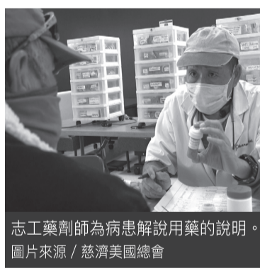
志工藥劑師為病患解說用藥的說明。

義診負責人鍾明樞表示，經過篩檢，醫療辦公室會為需要進一步治療的病人提供兩次眼科義診，安排專業醫師免費配鏡。牙科方面若需治療，將會安排他們回辦公室做治療和追蹤等後續服務。