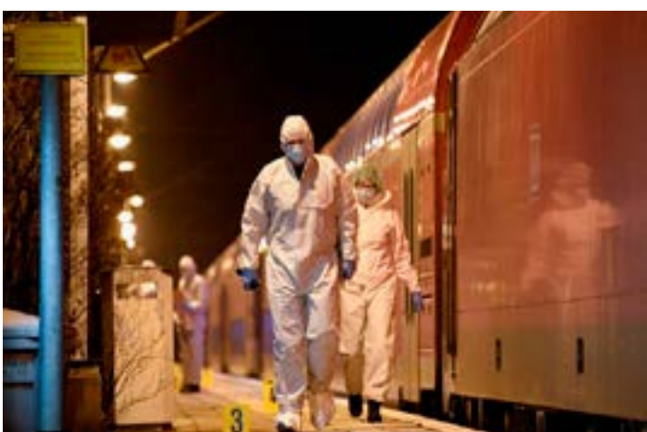
Forensic experts walk next to a train on which an incident involving a knife attack took place, at a railway station in Brokstedt, Germany.