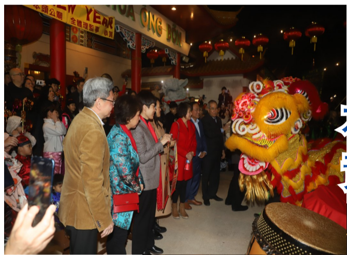
本頭公廟潮州龍獅團瑞獅搏兔慶新年