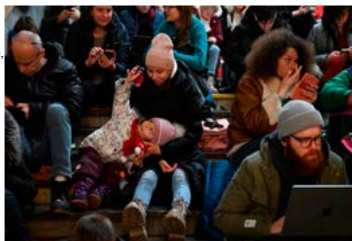
People take shelter inside a metro station during massive Russian missile attacks in Kyiv, Ukraine.