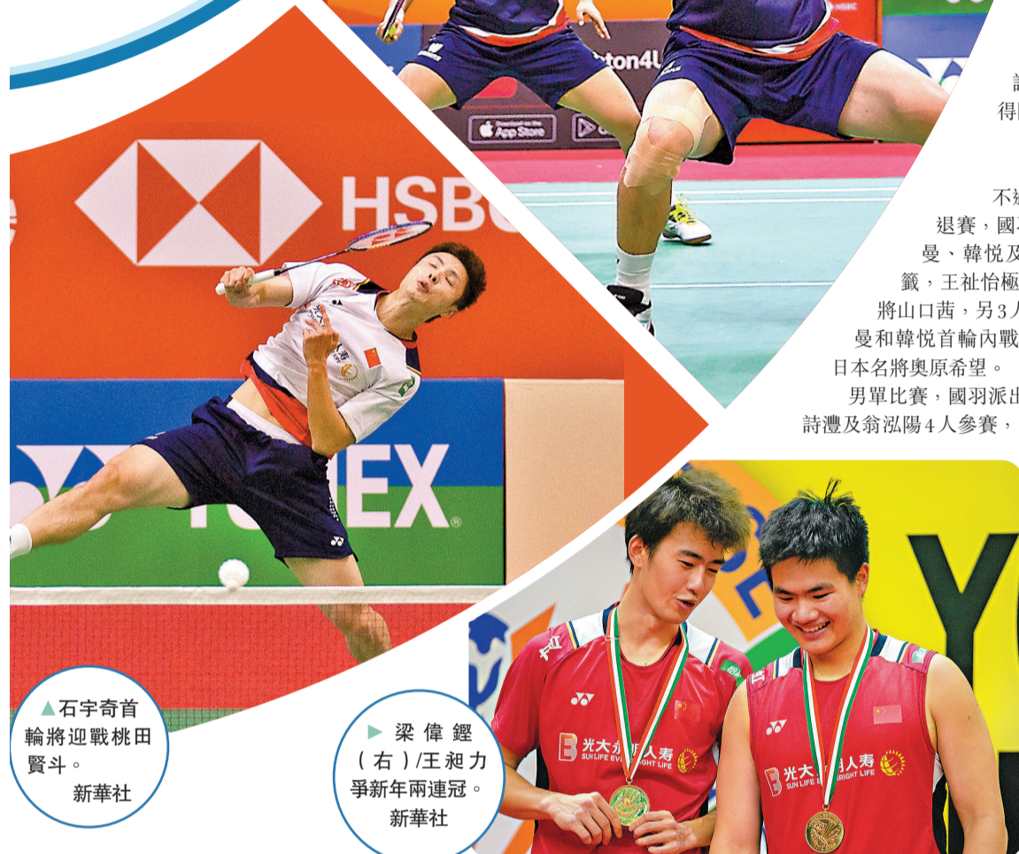
▲石宇奇首輪將迎戰桃田賢斗