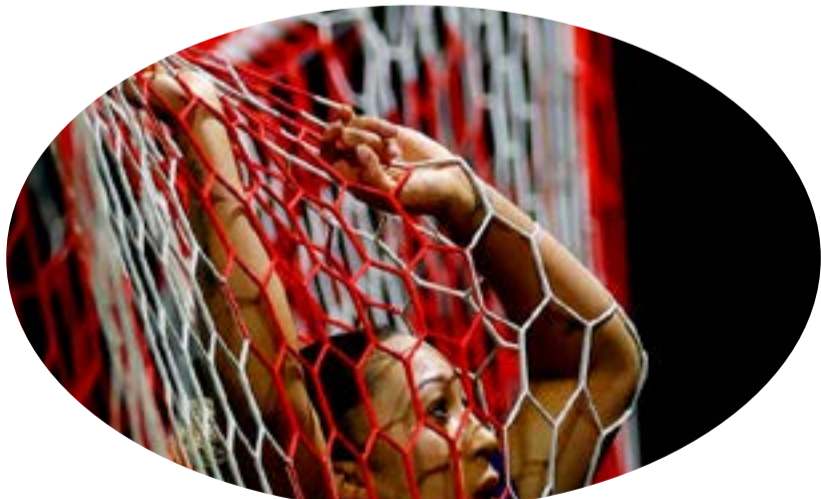
Chelsea's Lauren James reacts after missing a chance to score against Tottenham Hotspur during the FA Women's League Cup quarterfinal in London.