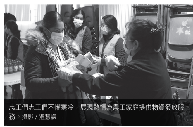
志工們志不懼寒冷，展現熱情為農工家庭提供物資發放服務。

昨天接到的第二位受災戶是大腸癌第三期；被診斷出癌症已經夠悲慘了，接著將是更多的檢查、化療及放療，但更糟的是突如其來的颶風，打亂了所有。她曾是老師，目前沒有保險，面臨病痛和毀了的家，眼前是一團糟的財務困境。