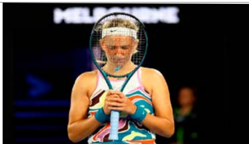
Belarus' Victoria Azarenka reacts during her semi final match against Kazakhstan's Elena Rybakina at the Australian Open.