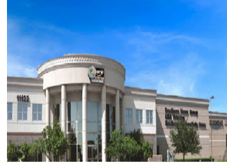
Southern News Group, Houston, Texas

Members of the community who have questions about any of the variety of issues the Center will address are encouraged to schedule interviews with the Center. The Center will link the person with a professional who can best address their needs.