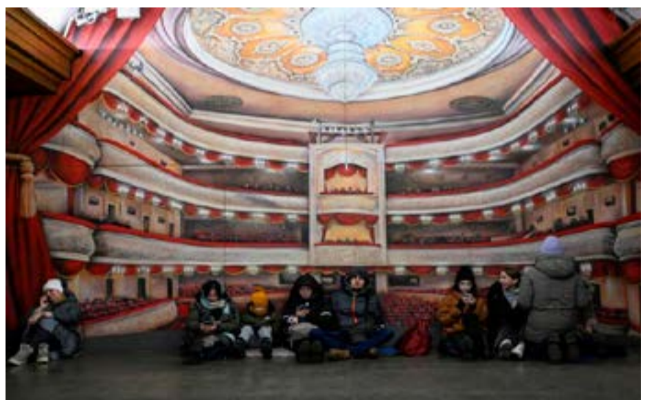
People take shelter inside a metro station during massive Russian missile attacks in Kyiv, Ukraine.