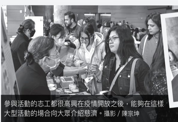
參與活動的志工都很高興在疫情開放之後，能夠在這樣大型活動的場合向大眾介紹慈濟。

慈濟志工透過結緣平安燈吊飾及幸運籤，分享《靜思語》等，深受會眾喜愛。此外，並通過介紹大愛感恩科技回收寶特瓶製作環保毛毯，並熱情地送上一杯溫暖的淨思烏龍茶；天然有機的靜思茶，茶葉含著清香，與會者品嚐著色澤