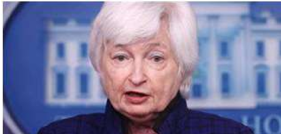
美國財政部長耶倫週二致信國會領導人，稱她將暫停將部分聯邦債券再投資於政府工作人員儲蓄計劃，這是一項額外的“非常”措施，旨在為拜登總統和國會爭取時間提高國家債務上限。

(休士頓/秦鴻鈞報導) 美國財政部長耶倫週二致信國會領導人，稱她將暫停將部分聯邦債券再投資於政府工作人員儲蓄計劃，這是一項額外的“非常”措施，旨在為拜登總統和國會爭取時間提高國家債務上限。政府上週四提高了其合法借款能力，促使財政部對聯邦僱員的退休和醫療保健計劃採取會計措施，這將使政府能夠在大約 6 月之前保持開放。耶倫在信中說，截至週一，她還確定政府“將無法完全投資”聯邦僱員退休系統中節餘儲蓄基金的政府證券部分。她指出，她的前任過去也採取過類似行動，並指出根據法律，“一旦債務限額增加或暫停，這些賬戶就會完整”。但白宮和國會如何就國會施加的人為上限找到共同點，這是一個懸而未決的問題。