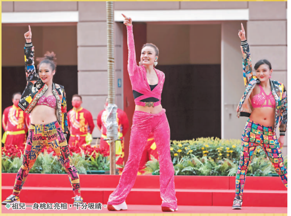
祖兒一身桃紅亮相，十分吸睛。