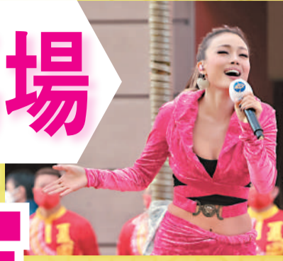
祖兒為現場馬迷獻唱多首金曲，場內氣氛熱烈。