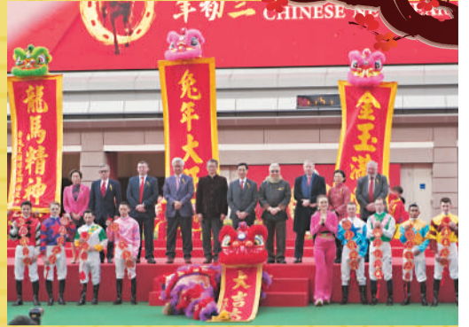
沙田馬場在大年初三舉行盛大活動。