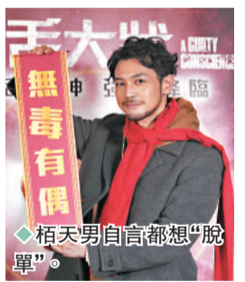
栢天男自負高都想脫單。