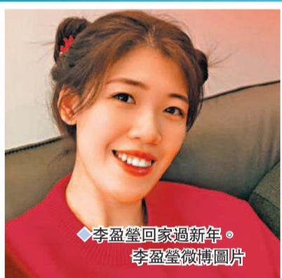
李盈瑩回家過新年。