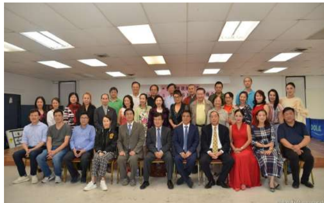
由中國人活動中心聯手大休斯敦地區60多家社團共同舉辦的2023年兔年新春聯歡晚會籌備工作穩步進行，節目選定，大咖雲集，值得期待，票務銷售也正式展開。圖為2022年12月11日舉行的第二次新聞發布會上，主辦單位、主創團隊和出席僑領全體合影，歡迎致電中國人活動中心和各大社團訂購