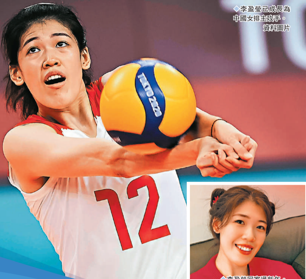
李盈瑩已成長為中國女排主攻手。資料圖片

最後,當聊起生活和愛好,李盈瑩又回歸了小女生的活潑。她喜歡美食,喜歡吃一切好吃的東西。她愛美,跟很多女孩子一樣,喜歡做美甲、弄頭髮,然後去接睫毛。但遺憾的是比賽時這些都要卸掉,所以她吐槽自己可以美的時間太有限。假期時,她會選擇去旅行、去爬山。這樣就能把所有負面能量釋放出去,就如她的微博名一樣瞬間滿血,成為『能量小盈瑩』。◆中新網