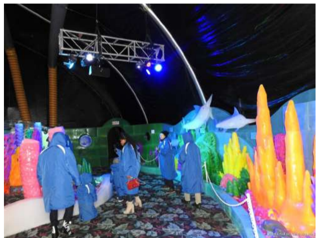
Moody Garden每年聖誕新年期間展覽的中國哈爾濱冰雕Ice-land今年主題是加勒比海聖誕，遠近各城市的住慣南方亞熱帶極少見到冰雪的孩子們此時可以在父母帶領下領略零下17度的冰天雪地，華人華僑也可以藉此一解鄉愁，在新年到來之際觀瞻中華文明的足跡，截止日期是2023年1月7日