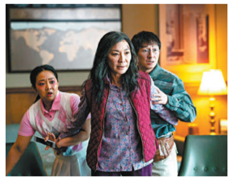
◆楊紫瓊憑藉《奇異女俠玩救宇宙》獲最佳女主角提名。

然而，這次與楊紫瓊競爭影后頭銜的對手亦不弱，包括最大對手姬蒂白蘭芝 (Cate Blanchett)，她亦憑藉劇情電影《TÁR》入圍。